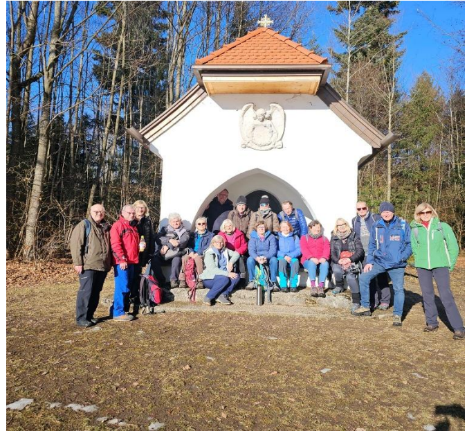
Vor dem Ziel wurde noch eine Abzweigung zur St. Blasius-Kapelle begangen. Weiter ging es Richtung Ortsmitte von Bad Tölz.